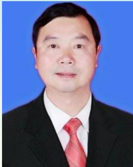
廖静宇 教授 硕士生导师 河南省教育厅学术技术带头人 原许昌学院数学学院院长